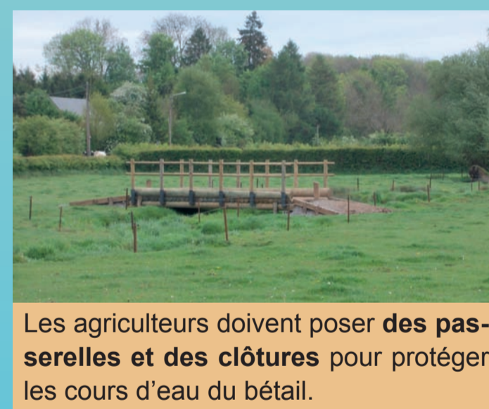
Les agriculteurs doivent poser des passerelles et des clôtures pour protéger les cours d'eau du bétail.