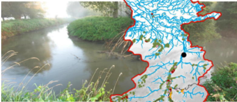
Dijle river basin