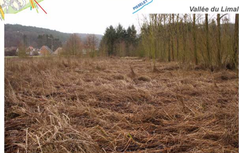
Vallée du Limal

Les différents instruments légaux qui permettent de protéger les zones humides sont issus soit de la législation sur la conservation de la nature (réserve naturelle, zone humide d'intérêt biologique,...) soit de celle de l'aménagement du territoire (zone d'espaces verts ou site classé au plan de secteur, plan communal d'aménagement, permis d'urbanisme...). Le contrat de rivière invite ses partenaires communaux et associatifs à démarcher auprès des propriétaires des zones humides qui ne sont pas protégées juridiquement, pour les sensibiliser et créer de nouvelles zones protégées, et ce en respectant le souhait des propriétaires et en collaboration étroite avec les agents forestiers de la Région wallonne.