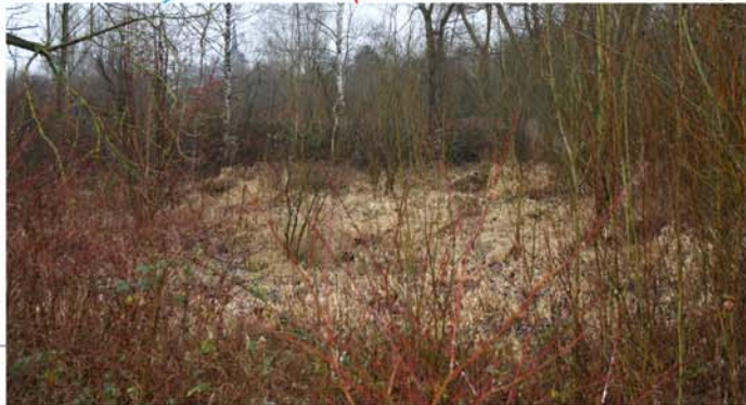
Vallée de la Dyle