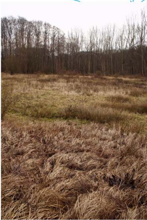
Vallée de l'Ermitage