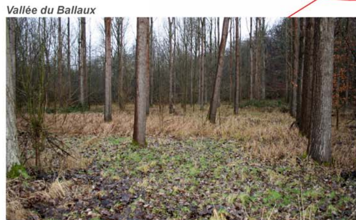
Vallée du Ballaux