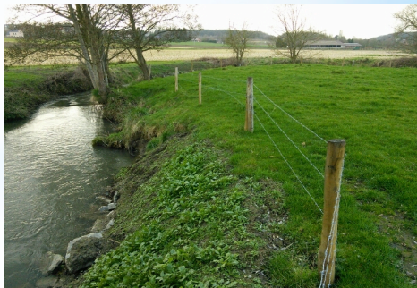
à Grez-Doiceau - le Train - agriculteur riverain - APRES