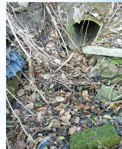
à Rixensart - la Lasne - Commune - APRES