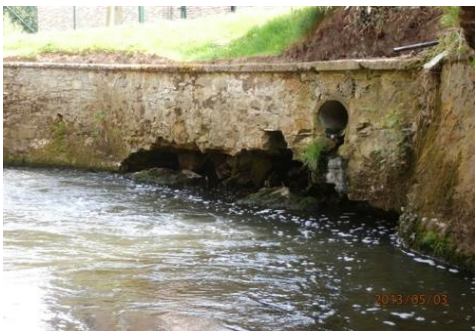
à Court-St-Etienne - l'Orne - SPW - AVANT