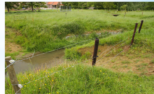
à Jodoigne - le Gobertange - agriculteur riverain - APRES