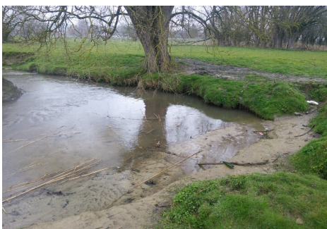
à Grez-Doiceau - le Train - agriculteur riverain - AVANT