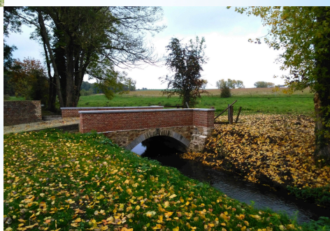
à Jodoigne/Ramillies - la Grande Gette - propriétaire riverain - APRES