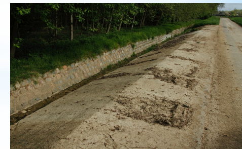
à Incourt - le Robiernu - Commune - APRES