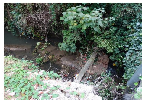
à Grez-Doiceau - la Nethen - Province du BW - AVANT