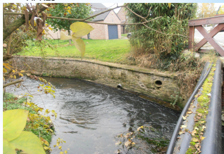
à Court-St-Etienne - l'Orne - SPW - APRES