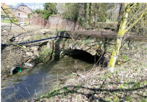
à Jodoigne/Ramillies - la Grande Gette - propriétaire riverain - AVANT