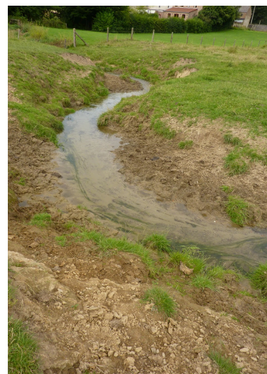
à Jodoigne - le Gobertange - agriculteur riverain - AVANT