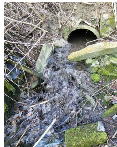
à Rixensart - la Lasne - Commune - AVANT