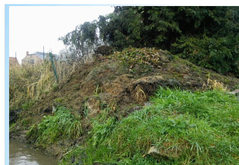
à Villers-la-Ville - le Gentissart - propriétaire riverain - AVANT