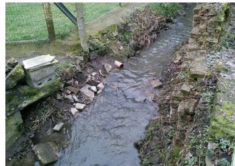
à Villers-la-Ville - le Pré des Saules - Province du BW - AVANT