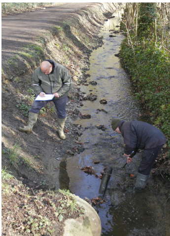
à Ottignies-LLN - la Malaise - Commune + Province du BW - AVANT