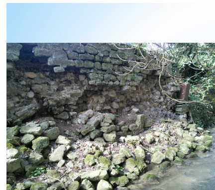
à Genappe - la Dyle - Province du BW - AVANT