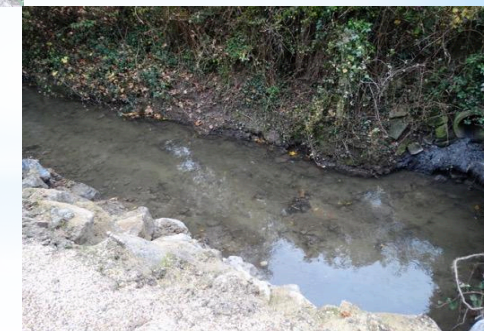
à Grez-Doiceau - la Nethen - Province du BW - APRES