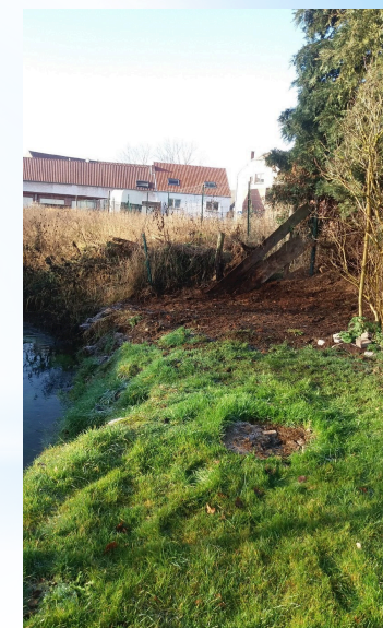
à Villers-la-Ville - le Gentissart - propriétaire riverain - APRES