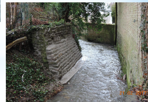
à Genappe - la Dyle - Province du BW - APRES