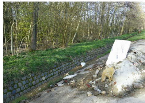
à Incourt - le Robiernu - Commune - AVANT