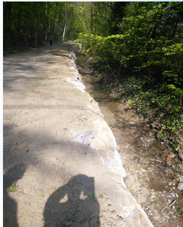
à Ottignies-LLN - la Malaise - Commune + Province du BW - APRES